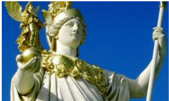
A Győzelem istennőjét, Nikét a kezében tartó Athéné szobor Bécsben, a Parlament előtt

Athéné, azon túl, hogy nőies volt, mindig humánusnak bizonyult. Elfordult azoktól, akik akár a háborúban is, megszegték az emberiség szabályait. A „heten Théba elleni” harcok során nem segített addigi pártfogoltján Tüdeuszon, amikor az, halálosan megsebesülve ellenfele levágott fejéből az agyvelőjét szívta ki, hogy visszanyerje életerejét, vagyis kannibalizmust követett el. Elfordult a görögök támogatásától, amikor Trója feldúlása közben a „kis” Aiasz az ő szobra előtt erőszakolta meg az egyik trójai királylányt, a jóstehetségű Kasszandrát.