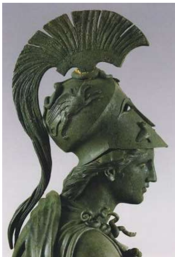
Athéné bronzszobra Krisztus előtt a IV. századból (Régészeti Múzeum, Pireusz)