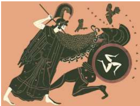
Athéné legyőzi Enkeladosz gigaszt (amfora ábrázolás, Szépművészeti Múzeum, Rouen)

Athéné a mai görög főváros névadója. Poszeidón (Neptunusz) tengeristen, Athéné nagybátyja szeretett volna beköltözni az Akropolisz tetején álló templomba, s ajándéku vízét adott a későbbi athéniaknak: háromágú szigonyát beledöfte az Akropolisz oldalába, ahonnan egy háromlyukú forrás tört fel. Értékes ajándéknak gondolta a lakosság, amíg ki nem derült, hogy Poszeidón nem adhatott mást, mint a lényege: tengervízét. Athéné ajándéka viszont az olajfa volt, ami az értékes olívaolaj révén a mai napig Görögország fő kiviteli termékét adja. Így Athéné nyerte el a várost. Az olajfa ezer évig él, nincs természetes ellensége a rovarok és a növényevő állatok között, tűri a szárazságot, nem igényel metszést, kapálást, permetezést vagy más gondozást, értékes a terménye és a szüretelése sem munkaigényes: mindössze egy hálót terítenek alá, mert csak a magától lehullott bogyó dolgozható fel.