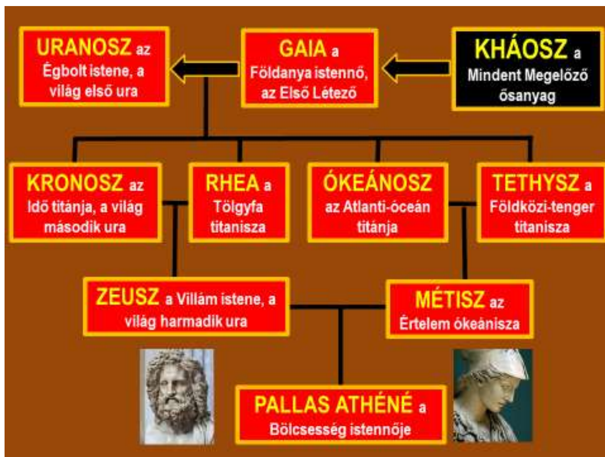
Pallasz (jelentése: „hajadon, szűz”) Athéné istennő, az „atya lánya” családfája (saját szerkesztés)

Arra „vigyázott” az apajogú társadalom új vallása, hogy mind a három hatalmas istennő Zeusz – a férfi atyaisten – lánya legyen! Athénének Métisz, a „szikrázó” Értelme; Aphroditének Dióné, a „megtermékenyítő” Eső; Perszephonénak Démétér, a „gabonaszóró” Termékenység az anyja.