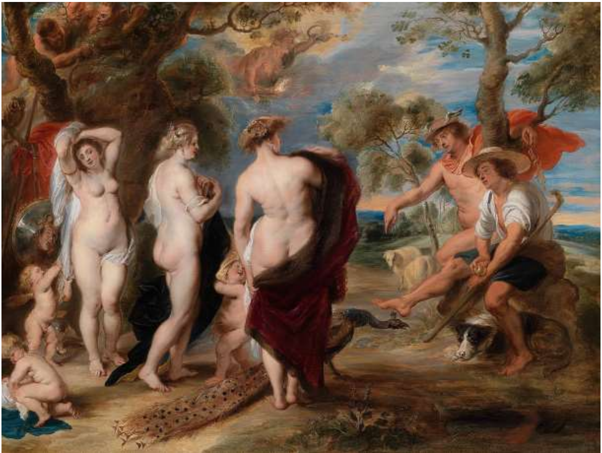
Rubens: Parisz ítélete (Nemzeti Galéria, London)

Athéné rejtett nőies vonásának egy megnyilvánulása, amikor hiúságáról tett tanúbizonyságot. Ezúttal nem szakmai féltékenység volt a tét, mint Arakhnével, hanem a szépség. Történt ugyanis, hogy az egyik szépséges habléányt, Thetiszt (Akhilleusz későbbi anyját), akit Zeusz szemelt ki magának, egy halandóhoz (Péleuszhoz) adták feleségül az istenek, mert a jóslat szerint Thetisz születendő gyermeke messze felülmúlja apja dicsőségét. A lakodalomra minden isten hivatalos volt, de Eriszt, a viszály istennőjét érthető okokból kihagyták a vendégseregéből. Ő erre egy aranyalmát gurított közjük „a legszebbnek” felirattal. Zeusz felesége, Héra (Júnó) úrnő, mint a világ királynéja, azonnal lecsapott az almára, de – érthetetlen módon – Athéné is igényt tartott rá, szintén a legszebbnek tartva magát. Természetes, hogy a harmadik jelentkező ténylegesen a legszebb istennő, Aphrodité (Vénusz) volt. Egy halandó férfit kerestek meg döntőbíróként – amely szerepre sem Hermész, sem Apollón nem vállalkozott érthető okokból. A kiválasztott, éppen a legszebbnek tartott halandó férfi volt, Parisz, a trójai királyfi. Ő elé járult a három istennő; Héra hatalmat, Athéné bölcsességet ígérve neki, míg a versenyt Aphrodité nyerte természetesen, aki a világ legszebb halandó nőjének (a spártai Szép Helénának) a szerelmét ígérte Parisznak. Így kezdődött a trójai háború, melyben Athéné és mostoha anyja, Héra, a görögöket, Aphrodité a trójaiakat támogatta értelemszerűen.