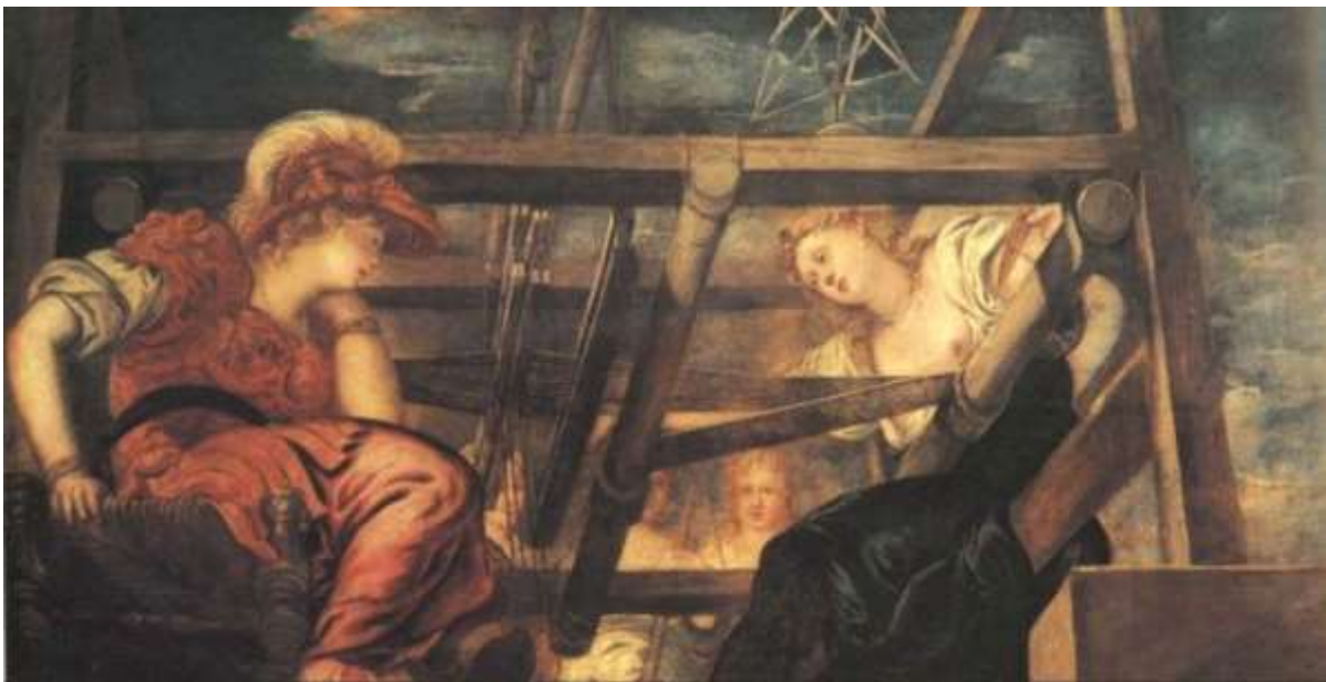
Tintoretto: Athéné és Arakhné (Pitti Galéria, Firenze)

Az istenek között leginkább nagybátyja, Poszeidón bosszantotta, ami annak tudható be, hogy a Földközi-tengert uraló kékhajú tengeristen szorosabb kapcsolatban állt a matriarchátus hagyományaival, míg Pallasz Athéné Zeusz elkötelezett lányaként a patriarchátus új világrendjét támogatta. Megnyilvánult ez abban, hogy Poszeidón, amikor egyszer meglátta, hogy Athéné Héphaisztosz kovácsműhelyébe tart új fegyvert csináltatni magának, tréfából úgy informálta a kovácsistent, hogy Athéné szeretné, ha megerőszkolná. Amikor a torzonborz kovács rávetette magát a gyanútlan Athénére, az természetesen ellenállt, s a dulakodásban Héphaisztosz véletlenül a földet, azaz Gaia Földanyát termékenyítette meg. A földből megszülető, kígyólábú fiút azonban megsajnálta Athéné, és sajátjaként nevelte fel Erikhtonioszt, aki az első athéni király lett, s halála után a „Kocsihajtó” csillagkép, mivelhogy ő találta fel a lovas kocsit. Máskor Poszeidón azzal bosszantotta Athénét, hogy az egyik legszebb tengeri istennővel, Medúzával, a Gorgóval egy Athéné templomban enyelgett. Athéné ezért kígyóhajúvá változtatta a szerencsétlen lányt, olyan rémisztőre, hogy aki ránézett, kővé vált. Később Perszeuszt segítette Athéné, aki megölte Medúzát, s fejét, a rémületes Gorgó-főt, az istennő pajzsára illesztette. Medúza halálakor adott életet Poszeidón fiának, a művészeknek ihletet hozó szárnyas lónak, a múzsák kedvencének, Pegazusnak.